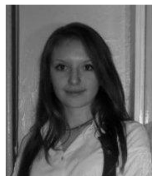
Интервью брала Розенштейн Маргарита

Остается лишь пожелать всем удачи и успехов в новом учебном году!